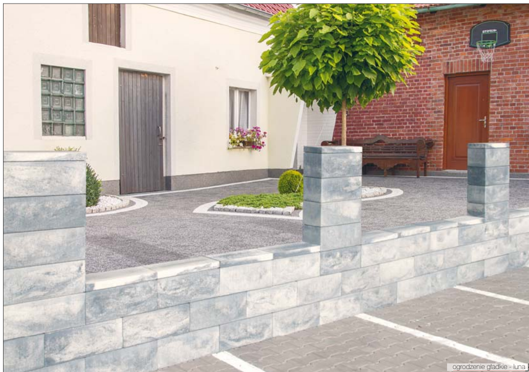
ogrodzenie gładkie - luna