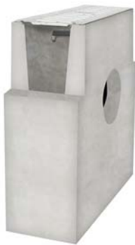
studzienka betonowa z pokrywą ocynkowaną