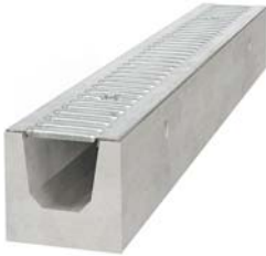
korytka betonowe z pokrywą ocynkowaną