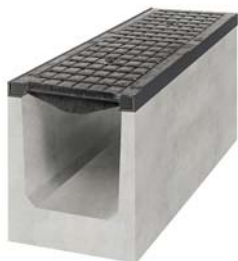
korytka betonowe z pokrywą żeliwną