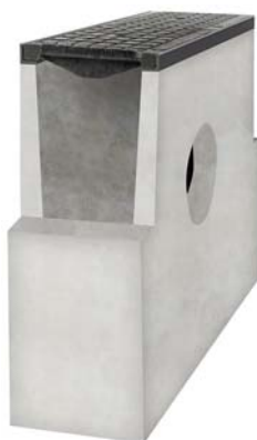
studzienka betonowa z pokrywą żeliwną