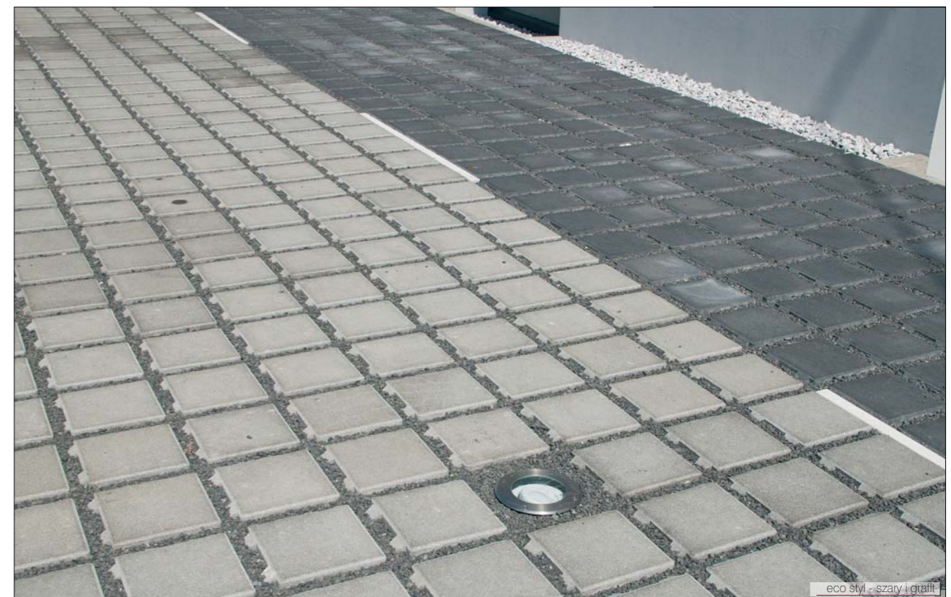
eco styl - szary i grafit

Eco styl – kostka brukowa dla wymagających. Kolor kostki, a przede wszystkim kształt pozwolą na połączenie funkcjonalności z odrobiną fantazji w projektowaniu Twojej przestrzeni. Nie lubisz prostych kształtów – tę kostkę stworzyliśmy właśnie dla Ciebie. Jej unikalność polega jednak na tym, iż doskonale odprowadza wodę do ziemi, która nie gromadzi się w większe kałuże ani nie spływa gwałtownie do kanalizacji burzowej. Doskonale sprawdzi się tak na prywatnym podjeździe, jak i na publicznym parkingu.