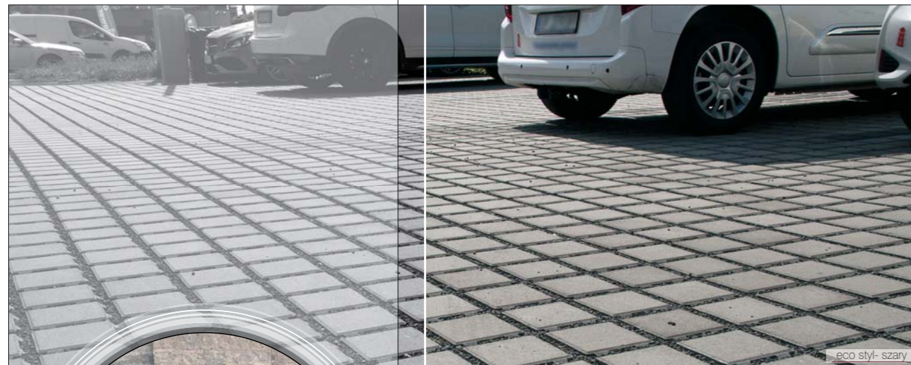
eco styl - szary