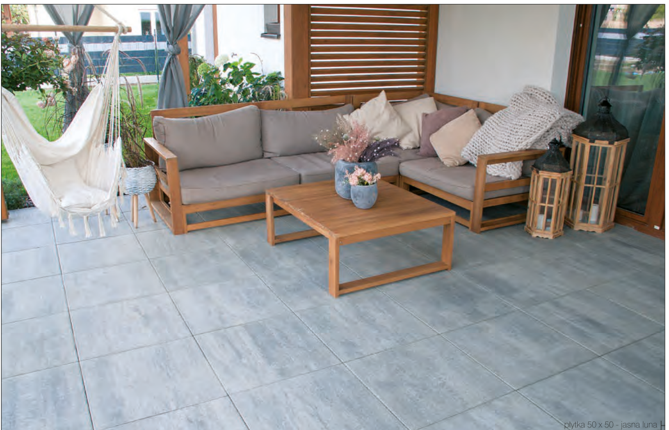
plytka 50 x 50 - jasna luna

Płytki 50 x 50 i 80 x 80 – jako nasza nowa płytki zagościć mogą przed Twoim domem. Szeroki wybór kolorów, trwałość i prosty, ale elegancki wygląd sprawia, że coraz więcej osób jest zainteresowanych ich położeniem w najbliższym otoczeniu. Wyglądają dobrze zarówno samodzielnie jak i w połączeniu z innymi naszymi płytkami. Przyjrzyj się dobrze – może również i Ty zdecydujesz się na zakup tych płytek na swój taras, alejkę ogrodową, czy też na większą część posesji.